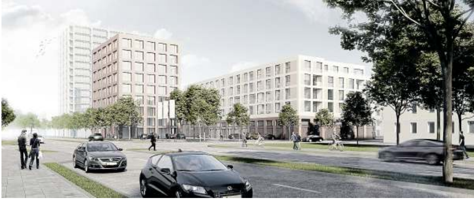
Blick von der Hans-Sommer-Straße auf den Langen Kamp: Das fünfgeschossige Gebäude in der Mitte ist für Einzelhandel und Wohnungen vorgesehen. Daneben entsteht ein neungeschossiges Bürohaus. Im Hintergrund ist das TU-Hochhaus der Elektrotechniker zu sehen – in der Realität strahlt die Fassade leider nicht so frisch.

Bis 2012 befand sich auf dem Areal die Geriatrie des Städtischen Klinikums. Der Standort wurde geschlossen, weil sich das Klinikum auf die zwei Standorte Celler Straße und Salzdahlemer