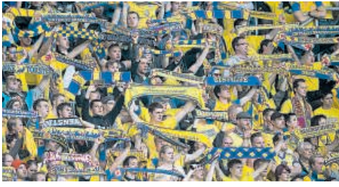
Braunschweiger Fans beim Spiel gegen Hoffenheim 2014.