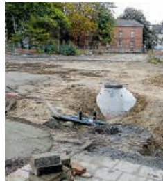
Zurzeit wird das Gelände erschlossen. Das alte Klinikgebäude bleibt erhalten, andere Gebäude wurden abgerissen.

Außerdem spielte der Umweltschutz eine große Rolle: Auf dem Gelände standen 88 zum Teil sehr alte Bäume – jetzt sind es nur noch 24. Es gab viel Kritik, vor allem von Anwohnern, vom BUND, von Linken und BIBS. Letztlich stimmte der Rat mehrheitlich für das Projekt, um schnell weitere Flächen für Wohnraum zur Verfügung zu stellen. Ein weiteres Argument: Eine Nachverdichtung in der Innenstadt sei ökologisch vorteilhafter als Flächenverbrauch im Außenbereich.